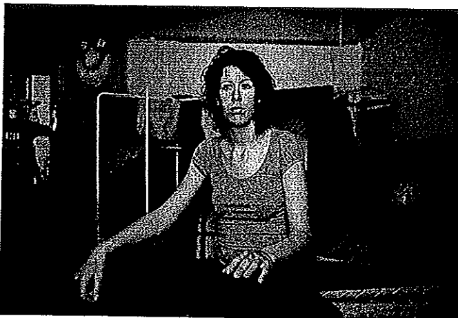
La solidarité familiale fait notamment défaut aux jeunes issus de l'ASE en matière de logement (ici dans un squat à Paris).

Aussi, comme l'a souligné en octobre dernier l'Observatoire national de l'enfance en danger dans un rapport sur La préparation et l'accompagnement des jeunes en fin de mesure de protection , « il est demandé à ces jeunes sortant des dispositifs de protection de l'enfance, plus vulnérables et disposant de moins de ressources, de faire plus et plus vite que la population générale dans l'accès à l'autonomie ». D'où l'idée d'une responsabilité particulière de l'ASE, qui a suppléé la famille pendant la minorité. Une responsabilité qui devra s'exercer tant que le droit commun ne répondra pas aux problématiques de ces jeunes aux profils spécifiques. Cette tâche, qui incombe donc aux départements, est d'autant plus lourde que l'Etat a choisi en 2005 (*) de réduire fortement les mesures de protection des jeunes majeurs, jusqu'alors exercées par la protection judiciaire de la jeunesse (PJJ). « Il n'y a pas eu de transfert