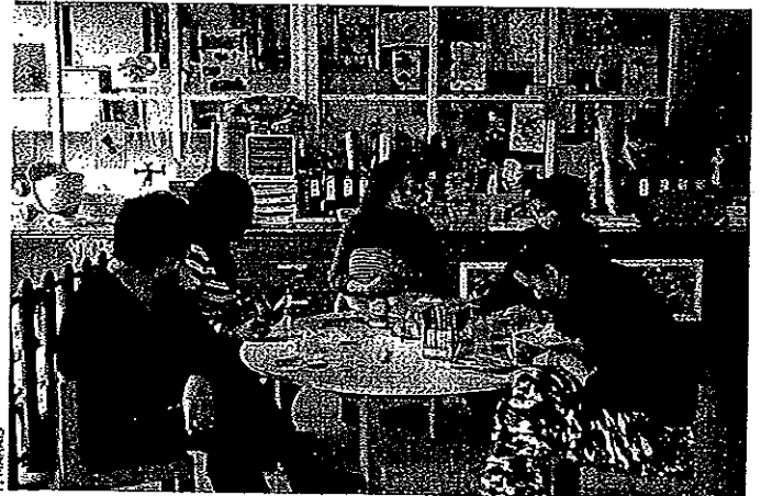
La loi de janvier 2002 a créé une obligation d'évaluation interne et externe (ici un service de l'ASE de la Seine-Saint-Denis).