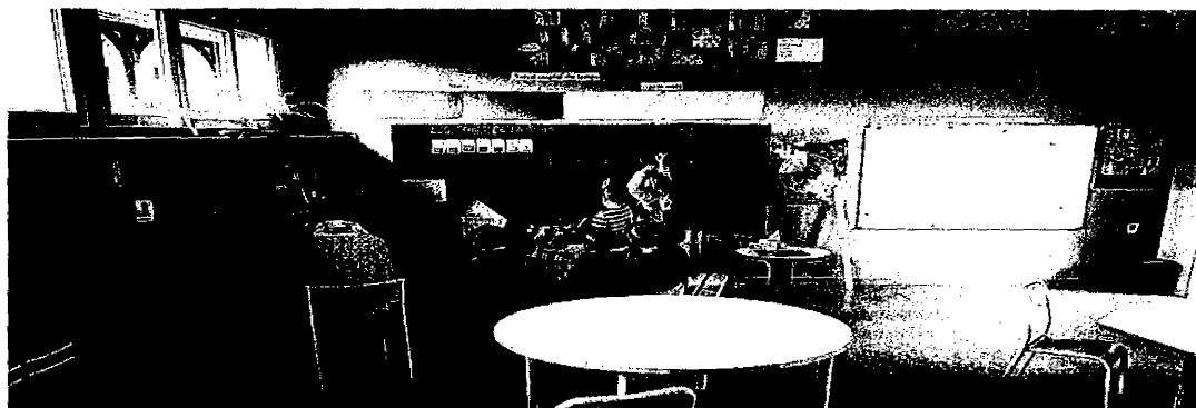
Une classe de maternelle, dans le Lot, en 2017.

Discrets mais indispensables, ces agents territoriaux spécialisés des écoles maternelles demandent une revalorisation de leur métier.